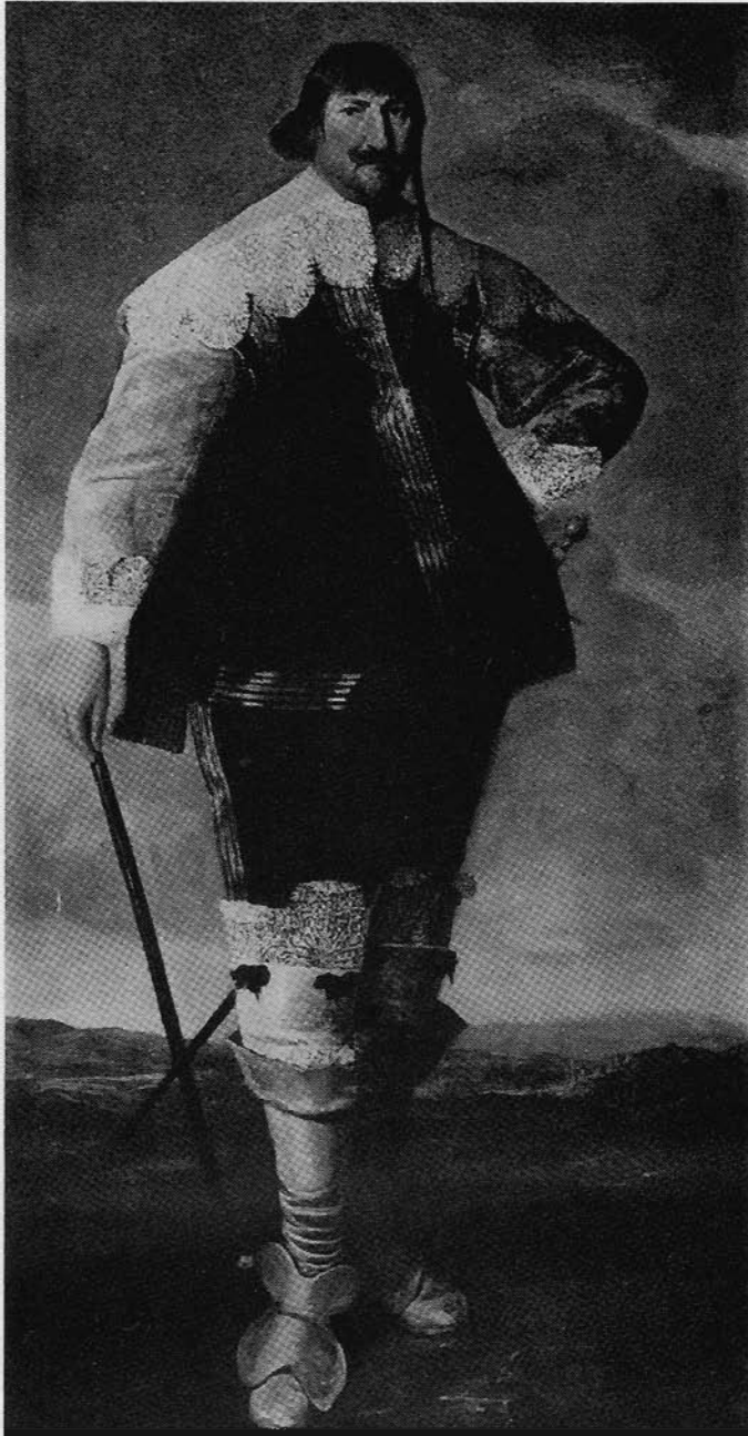
Im nationalhistor. Museum in Frederiksborg befindet sich dieses Gemälde, das den dänischen König Christian IV. (1577 - 1648) auf einem Gemälde von Abraham Wuchters zeigt; entstanden 1638.