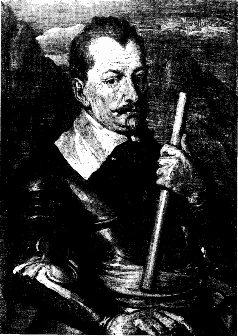
Graf Albrecht von Wallenstein