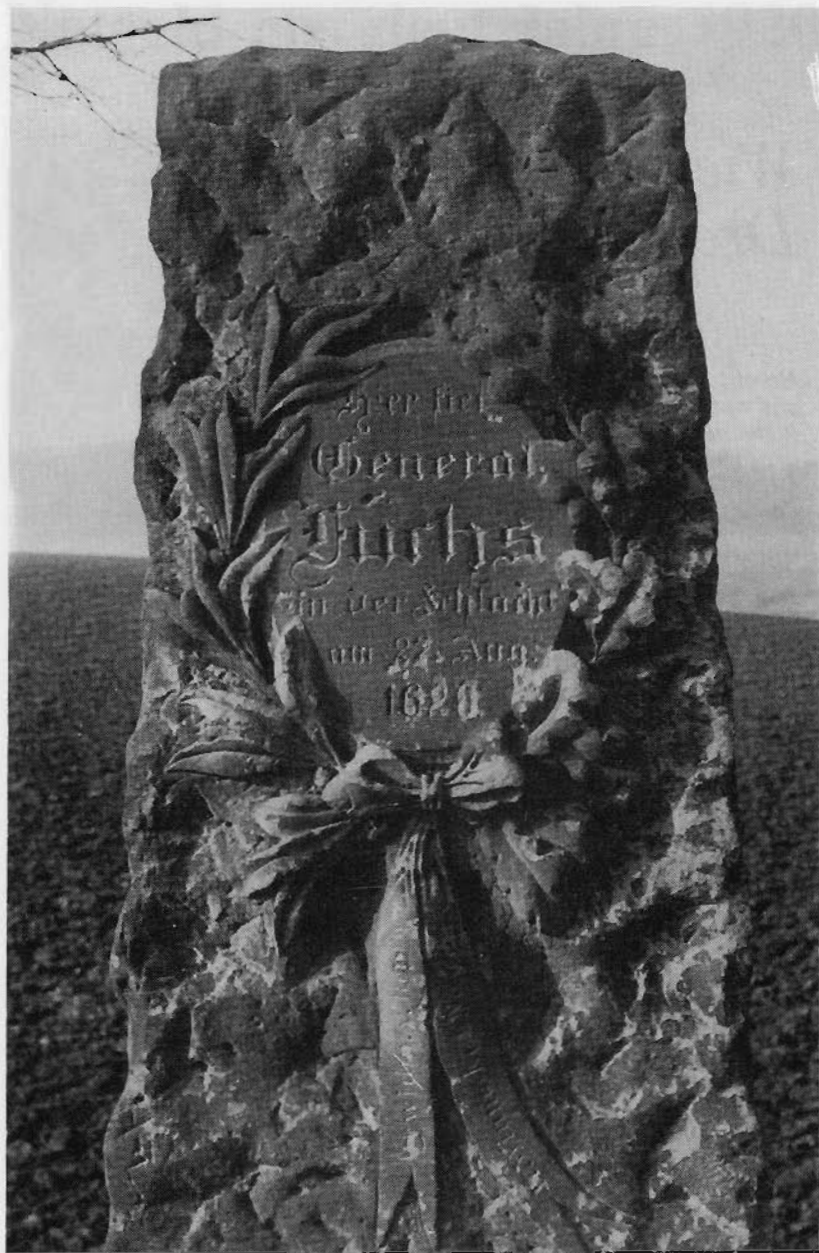
Der Rentier Winnecke aus Nauen stiftete 1908 das Fuchs-Denkmal, das zur Erinnerung an den in der Schlacht am 27. August 1626 gefallenen General erinnern soll. Heute steht es wieder an der B 248 (Parkplatz).