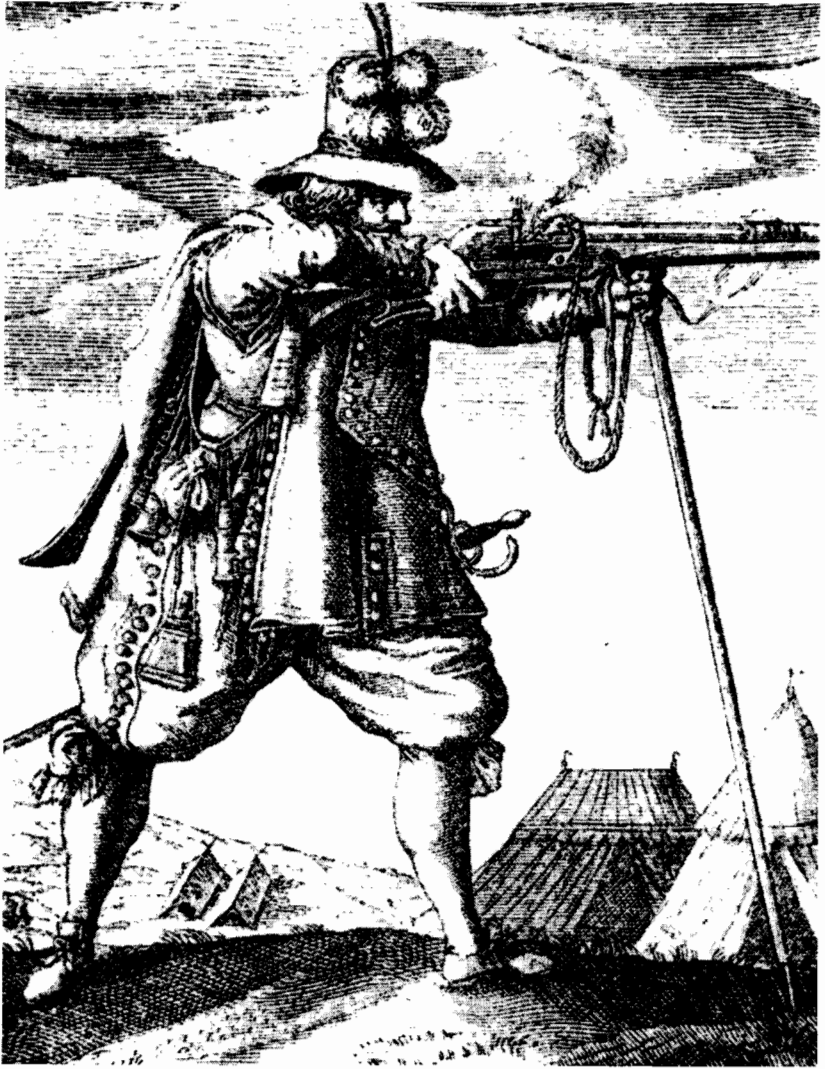
Musketier mit einer Luntenschloßmuskete