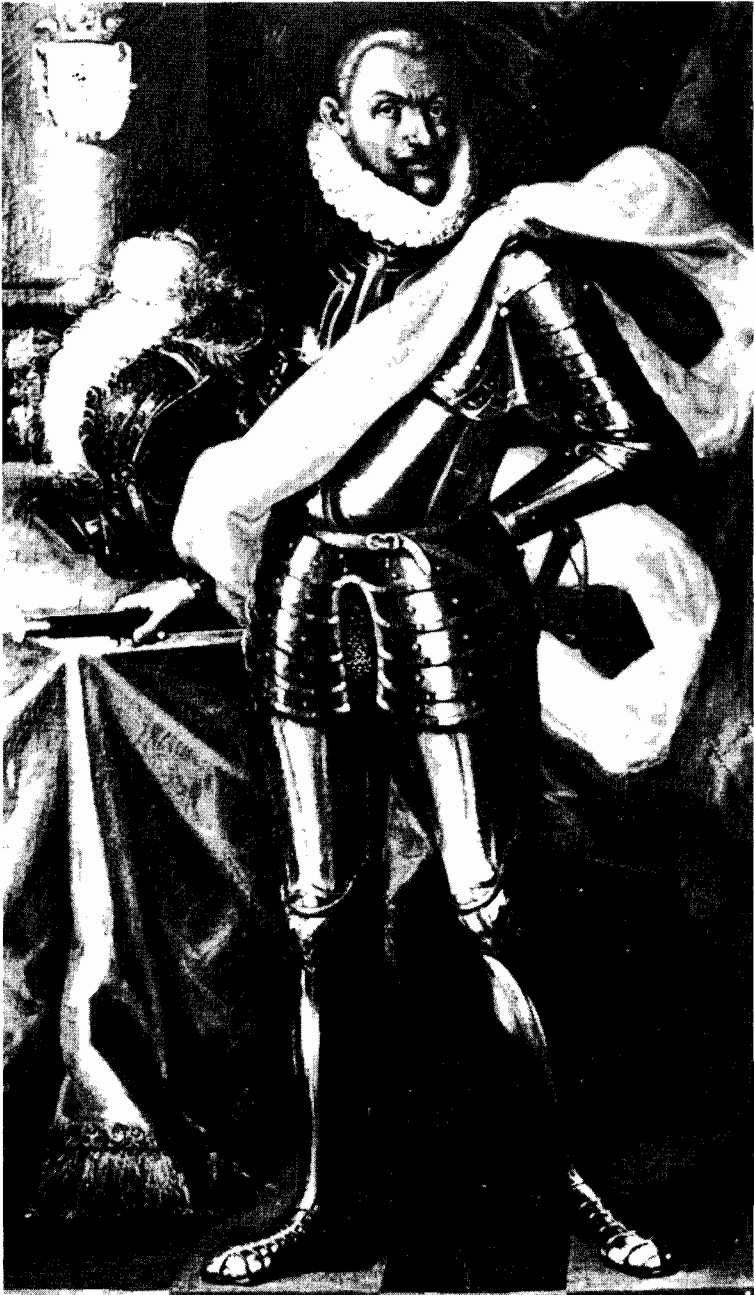
Johann Tserclas Graf von Tilly

(Bildnis eines unbekannten Meisters; einzige derartige zeitgenöss. Darstellung)